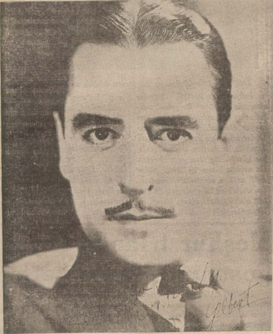
Jilbertin bizzat gazetemiz için imzaladığı son resmi

Holivut, (Hususi) — Size bu mektubumda çok şayanı dikkat ve eğlenceli bir hâdiseden bahsedeceğim. Nevyorkta çıkan büyük bir sinema mecmuası Holivuda hususi bir muhabir göndererek artistler arasında hoş ve cazip bir anket tertip etmiştir. Muharrir hemen bütün yıldızları ziyaret ederek onlara bir sual sormuş ve çok tuhaf cevaplar almıştır. Muharririn sorduğu kısa sual şudur: