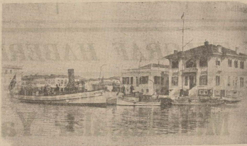
Rıhtımın İnşa edildiği Sahil Sıhhat İdaresinin önü

Bunların haricinde girilen en mühim iş Kalemize bir rıhtım inşasıdır. Buradaki Sahil Sıhhiye İdaresinin önüne yeni bir rıhtım yapılmaktadır. Şimdiye kadar gerek sakin, gerekse dalgalı ve fırtınalı havalarda açıkta duran