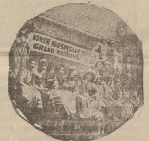
Bu defaki piyanogoya çekmiş memur kızlar

Bu kızlar, evvelâ yemin ettirilir, sonra sırtlarına bir mayo giydirilir ve hiçbir taraflarına bir kâğıt parçası saklıyamıyacak bir hale getirildikten sonra, adedi milyonları bulan piyango fişlerini karıştırmaya memur edilirler. Bu fişler karıştırıldıktan sonra elektrikle hareket eden dolaplara yerleştirilirler.