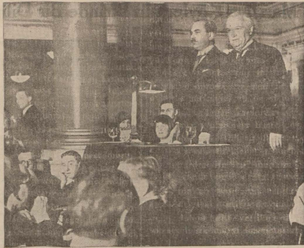
Londra, 22 — Loit Corç oldukça gürlüğü bir surette siyasi hayata avdet ettikten sonra Alber Holde bir konferans vermiştir. M. Loit Corç bir defa daha hükümetin tatbik attığı gümrük himaye tedbirlerini tenkit etmiştir. Loit Corçun bu münasebetle, mecliste bazı acı tenkitlerde bulunması bekleniyor.

Aynı zamanda birçok Amerikan maliyecinin fikri de sorulmuştur. Bu tetkikat, paraya gümüşün esas itibaz edilip edilemeyeceği noktasından yapılmaktadır.