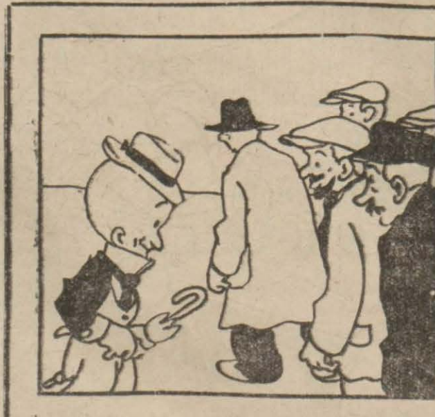
1: Hasan Bey — Pazar ola kömürcübaşılar, böyle tabur halinde nereye gidiyorsunuz?