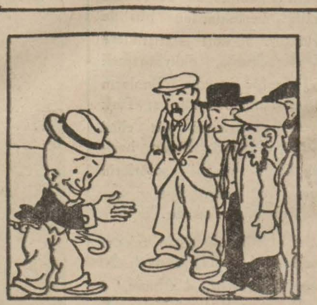
4: Hasan Bey — Haydi gidin bakalım, belki o da size kahve yerine bir kar fırtınası ikram eder!