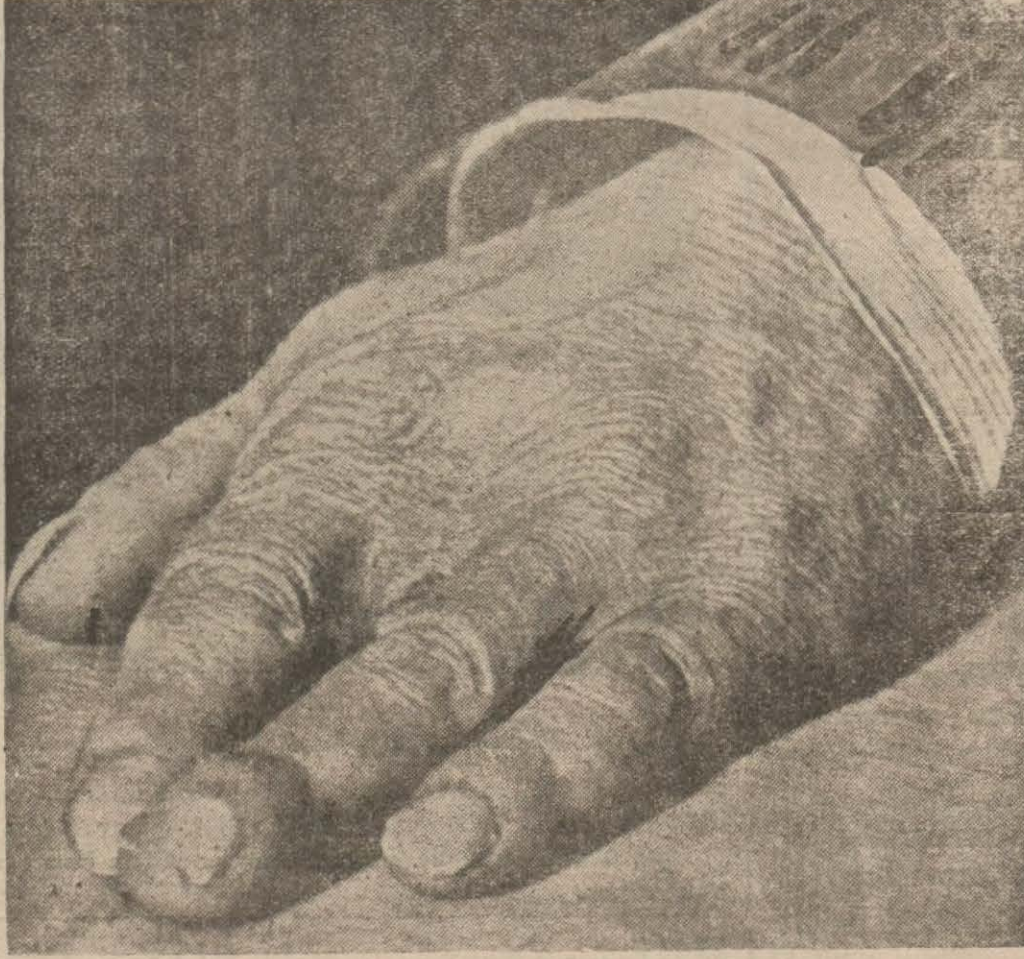
Sahibini ele veren kesik parmaklı el..