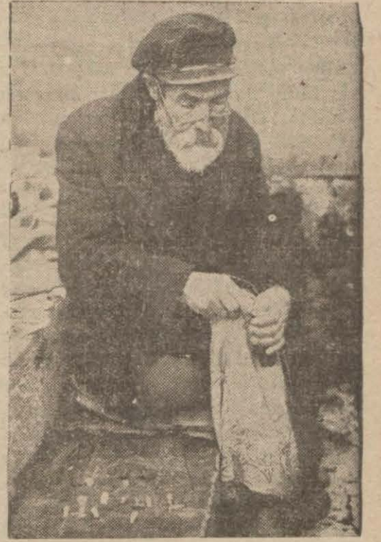
Son karar ile mesleklerine hitam verilen mühürçülerin seneler görmüş bir timsali

Bu karar, bu aydan itibaren tatbik edilecektir. İmzaların mühür halinde kazılmış olmasına da cevaz verilmemektedir. Esasen Borçlar Kanunu da mühür