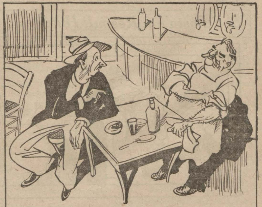
— Usta barba, bu ne yahu, şarap değil sirkel — Fena mı, salataya dökersiniz!