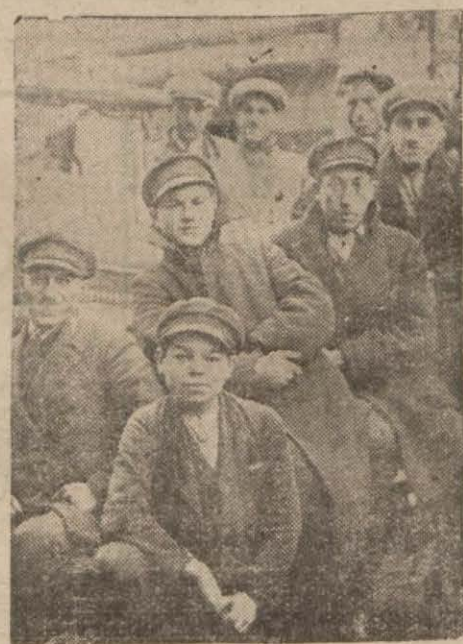
Yeni Kanunî kararı meserretle karşılıyan Türk Şoförler Diğer meslek erbabının cetveli henüz tamamlanmamıştır.

Milliyet itibarile şöyle taksim olunmaktadır: (17) Yunanlı, 20 İtalyan, 17 Fransız, 4 Alman, 4 Sırp, 45 beyaz Rus mülteci ve 6 muhtelif milliyette şoför. Şu hesaba göre işten menedilecekler, ancak 107 ehliyetnameli ecnebi şofördür.