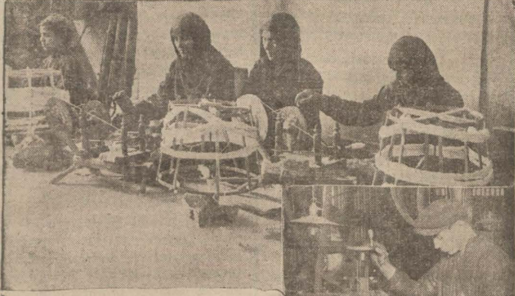
Yeni kanun projesile tehdide uğradığı iddia edilen küçük sanayiye ait faaliyet

Hükümetin yeni bir Teşviki Sanayi Kanunu ile bir Banka kanunu hazırladığını evvelce yazdık. Bu kanun projelerinin küçük ve büyük sanayicilerimizi ve umumiyetle halkı ehemmiyetle meşgul ettiğini söylemek zaittir. Bu münasebetle gerek küçük ve gerek büyük fabrikacılar yakında Ankara'ya bir heyet göndererek bu kanun projelerinin şimdiye kadar intişar edip te noksan görülen kısımlarının tadili teşebbüsünde bulunacaklardır.